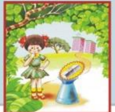
Их могут установить в урнах, под скамейками, в транспорте, на лестничной площадке, в любых общественных местах.

Действия, которые ты должен предпринять при обнаружении бесхозных вещей.